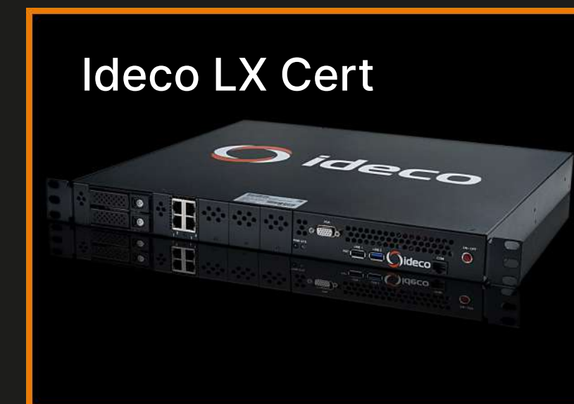
Ideco LX Cert