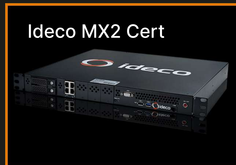
Ideco MX2 Cert

Программно-аппаратные комплексы производства «Айдеко» позволяют максимально быстро внедрить Ideco UTM на протестированных платформах.